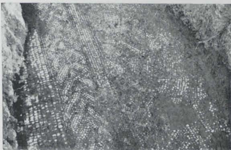
Fig. 28