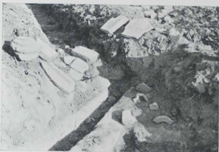
Fig. 29