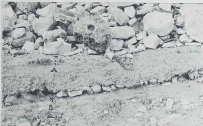
Fig. 31

El lloch de la troballa del forn de referencia es en l'anomenat Pla de l'Abella, propietat de La Sala de Linyà, municipi de Nevés, apareguent aquests entre diversitat de fragments, els quals, si no han permès reconstruir per