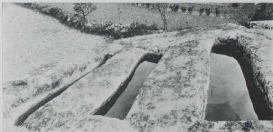
Fig. 30

Al costat d'aquestes troballes més importants, aparegueren gran nombre de troços de terra cuita pertencients a objectes de gran dimensió, tals com nances y brochs d'àmfora, tègules, parets de